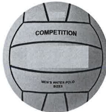
Fig. 1: Men's Water Polo Size Ball