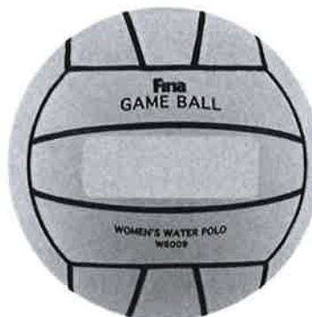
Fig. 2: Women's Water Polo Size Ball