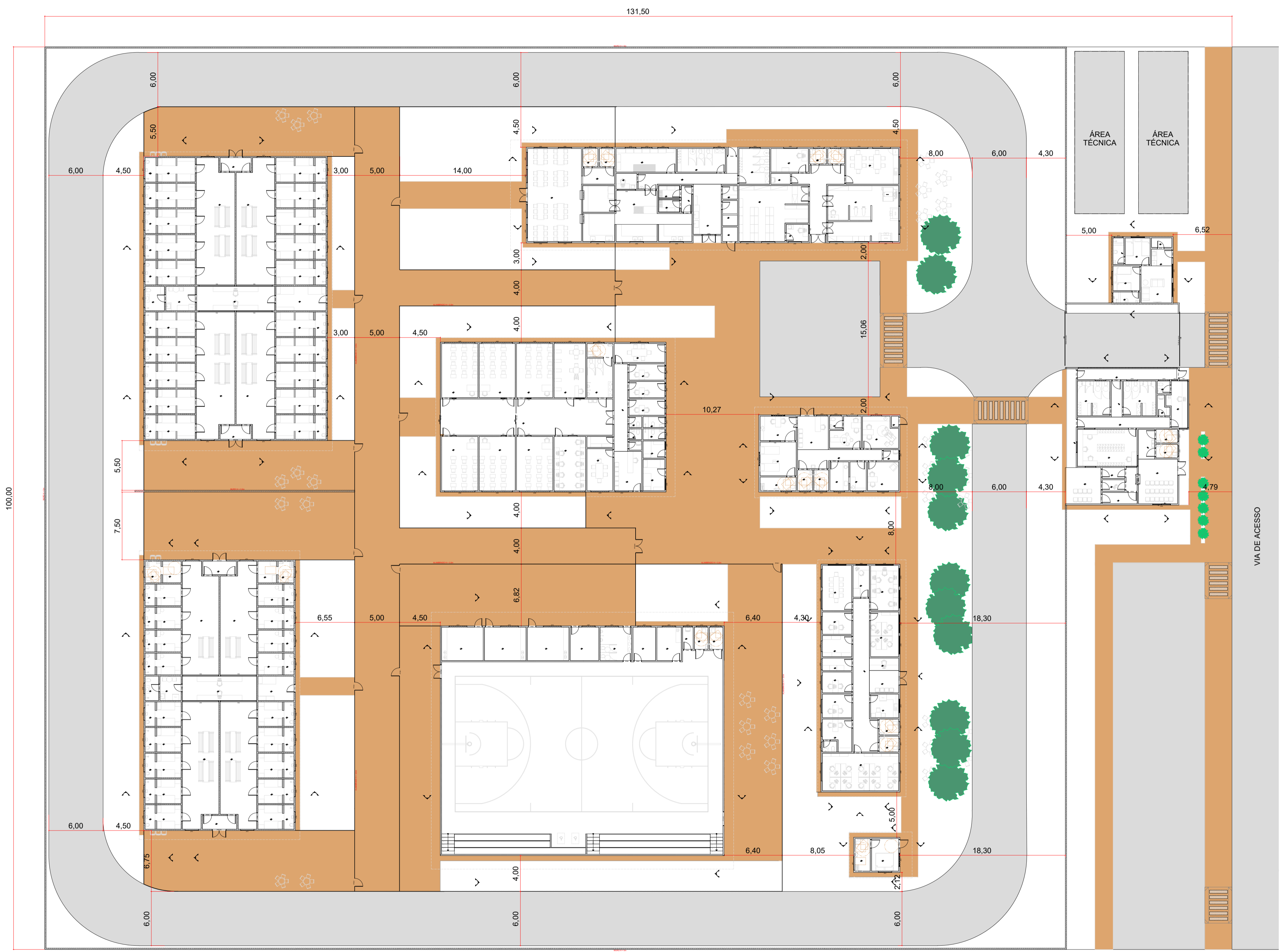
1 Implantação Escala: 1:250